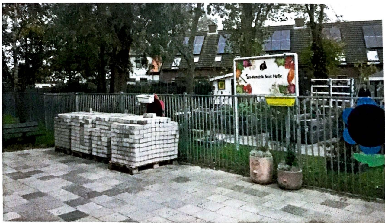
Jan-Hendrik Smit Hofje