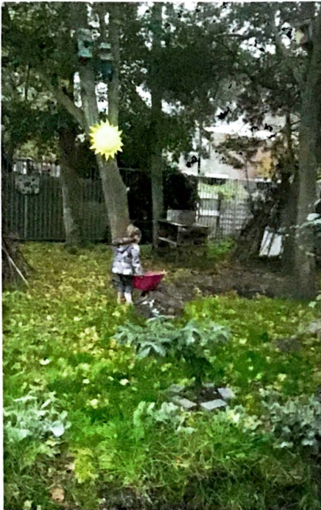
Speelplek voor de kinderen