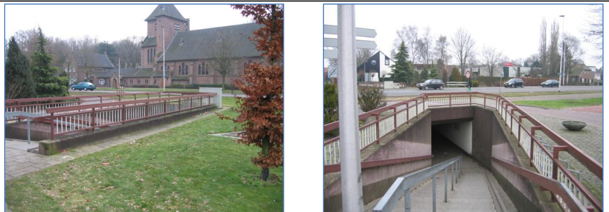
De aanblik van de tunnel in de huidige situatie met het hek en de toegang naar de tunnel (vanaf kerk)

Het dorp Mariënheem wordt doorkliefd door de N35. De school en de kerk en enkele woningen zijn gelegen aan de zuidzijde van de weg. Het overgrote deel van de bebouwde kom en verschillende voorzieningen zijn gelegen aan de noordzijde van de weg. Bewoners moeten de weg veelvuldig oversteken. Het verkeersaanbod is sterk toegenomen. In de 70-er jaren van de vorige eeuw is de tunnel aangelegd in Mariënheem als mogelijkheid om de N35 te kunnen oversteken. De ruimte was destijds en is nog steeds beperkt. Gevolg is geweest, dat er een tunnel is aangelegd met aan weerszijden trappen en naast de trappen een fietsgoot. Gebruikers moeten de fiets aan de hand meenemen door de tunnel. Gevolg is geweest een altijd beperkt gebruik van de tunnel.