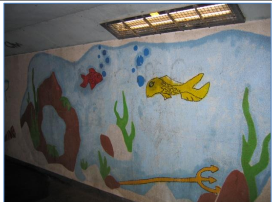
De schilderijen in de tunnel als aangebracht in 1994