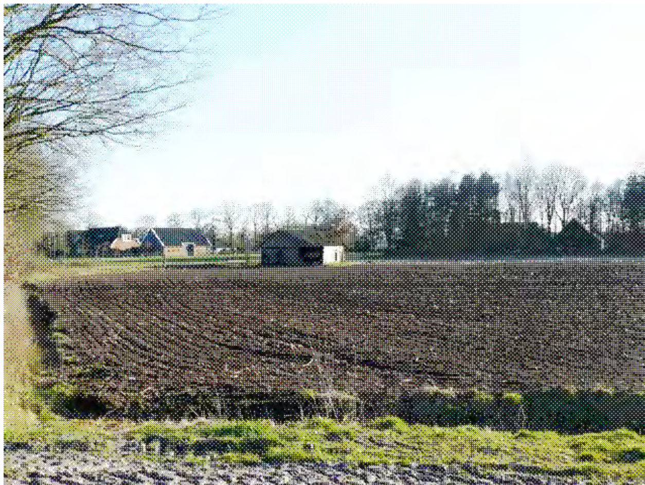
foto 1, "omgeving" voldoende ver van andere bebouwing, rechts de bossingel en contouren van het huis van Van Duijn, links de boerderij van Fokkens. In het midden het schuurtje van boer Kruit.