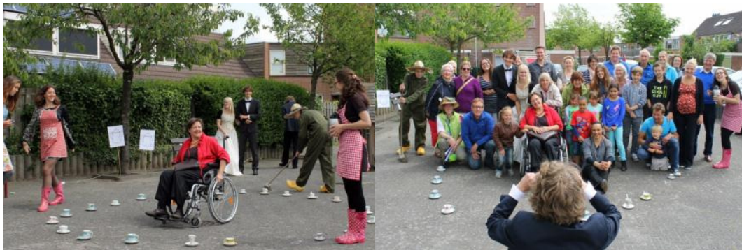
Theater act 'Koppie doen' door jongeren van het Artiance Productiehuis en Jolanda op het pleintje.

Door het organiseren van het 30-jarig jubileum en de buurtsafari en alle aandacht in de media en de wijk is het buurthuis 't Ambacht weer op de kaart gezet. Door alle verhalen, interviews, gedichten, liedjes en theateracts heeft het buurthuis meer bekendheid gekregen in de buurt en hebben buurtbewoners en de buurt een gezicht naar buiten gekregen. Door de dvd die van het project is gemaakt zullen zowel de levensverhalen, als organisaties zoals het buurthuis meer bekendheid in de buurt krijgen, en ver daarbuiten.