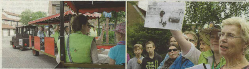
Sfeerimpressie van Buurtsafari Alkmaar-Noord.