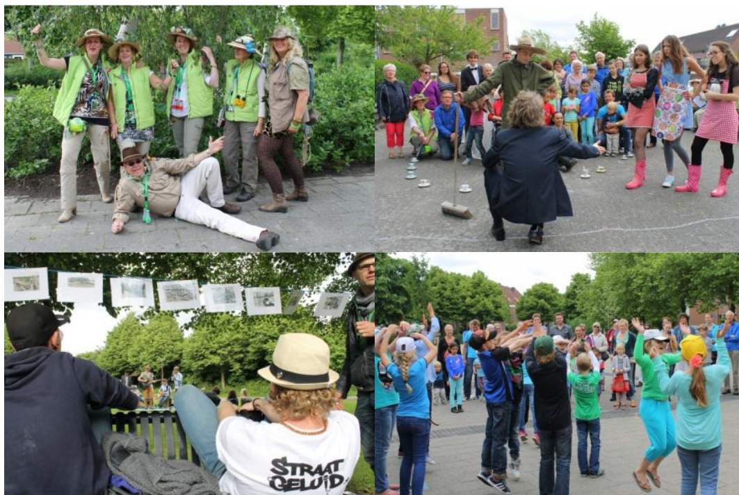
Tourbegeleiders; Koppie doen bij Jolanda; To be continued en Straatgeluid; Sterrenwachter.

De inzet van de vijf Univé mensen als tourbegeleider was een goede zet. Ze hadden zichzelf mooi verkleed en ze vermaakten het publiek. De buurtsafari kreeg een extra positieve lading door hun deelname en ook zijzelf vonden het erg leuk om op deze wijze invulling te geven aan maatschappelijk betrokken ondernemen.