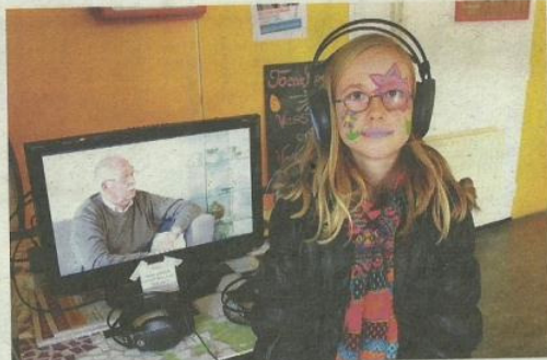
Ga op onderzoek uit tijdens de buurtsafari van zaterdag 29 juni in de Mare.

ALKMAAR - Kinderen fotograferen is een prachtige bezigheid. Sinds lange tijd kunt u in uw straat, of op het plein een fotograaf van Rodi Media verwachten. En natuurlijk goed Alkmaar op Zondag in de gaten houden