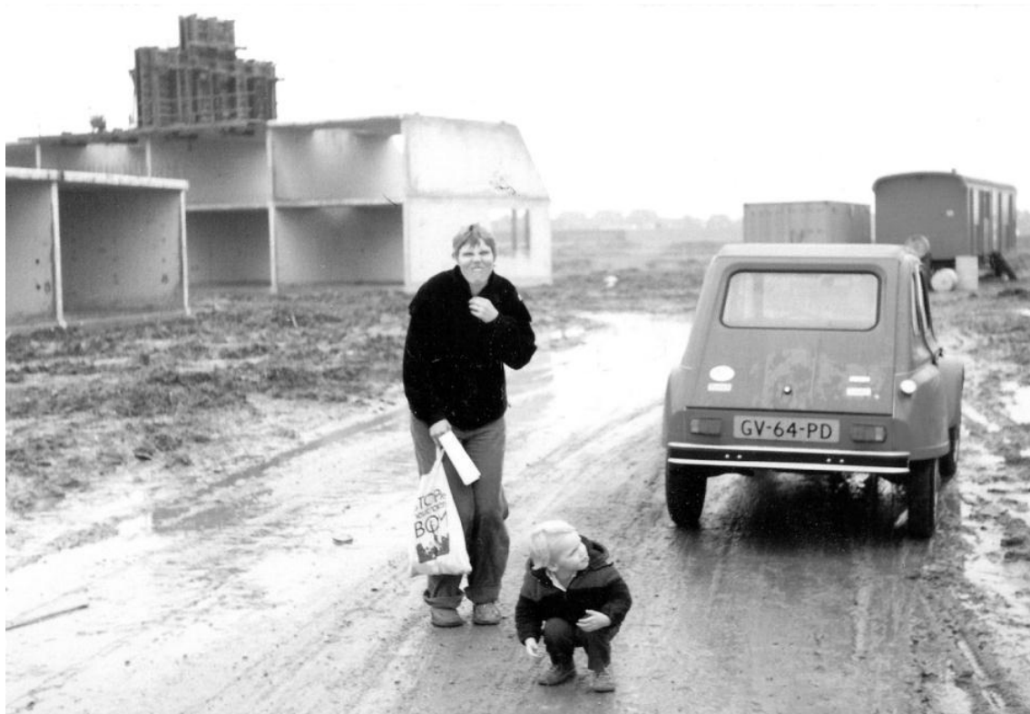
FOTO straat in aanbouw

Zo'n 30 jaar geleden kwam ik hier wonen, in een gloednieuw huis, nieuwe buurt, nieuwe stad. Met een peuter en een baby, dus gericht op de toekomst. We zijn bezig, bezig, bezig! Ik weet nog hoe we ons letterlijk de blaren op de vingers hebben gewerkt en hoe mager ik was geworden, maar ook hoe fijn ik me voelde. We kwamen uit Haarlem, ik werkte daar als boekenredacteur en hield enorm van dat werk. Maar Alkmaar betekende – met die twee kinderen – na het zitten op een flat, meer ruimte, meer rust, meer natuur tussen veelal jonge gezinnen hier. En die eigen tuin vond ik meteen heerlijk!