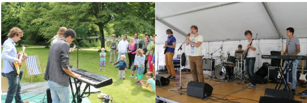
Lied Joost door To be continued op de generale repetitie, de buurtsafari en het zomerfestival.