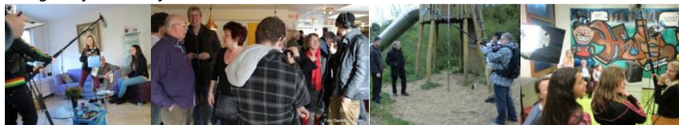
Jongeren van het Dalton College, jongerencentrum Argus, huiskamer de Daalder en basisschool de Bijenkorf in actie.