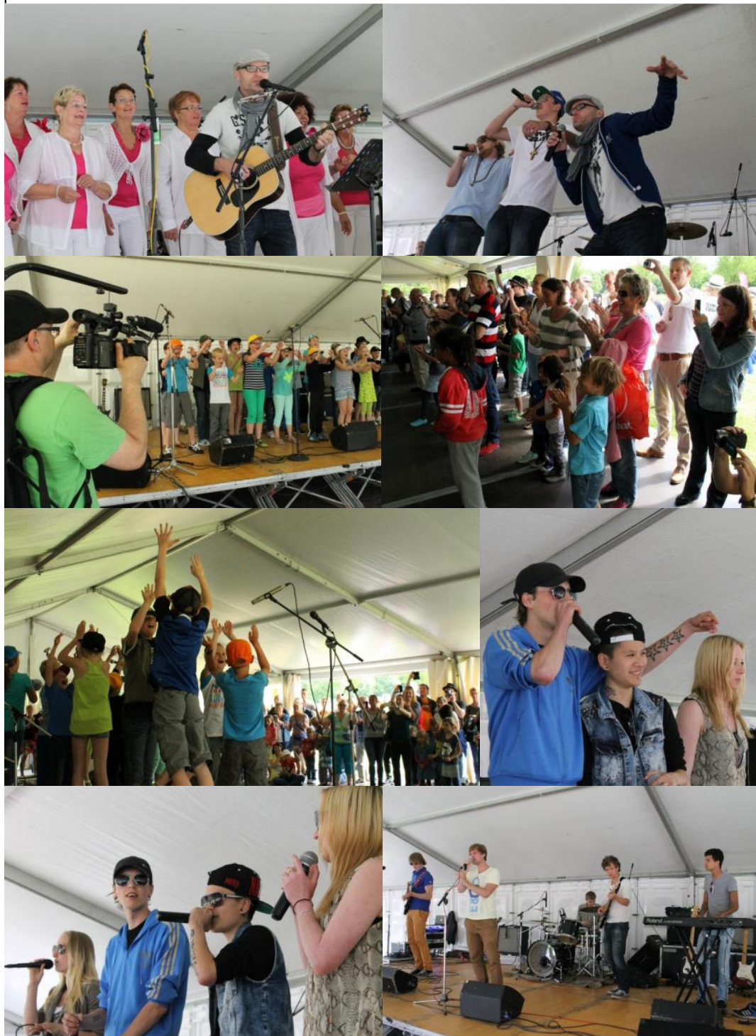
De Toen en Nu-muziekacts op het Rekerhout Zomerfestival.