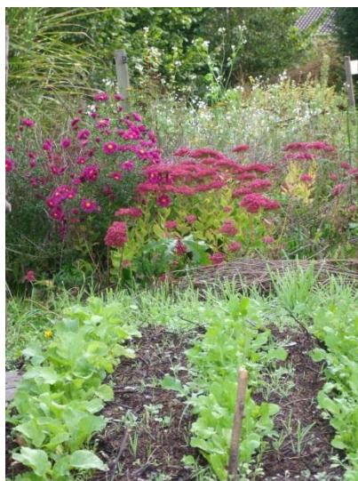
Foto: herfstaster en hemelsleutel, ook zeer geliefd bij insecten en vlinders, op de voorgrond radijs, rucola en veldsla.

Onze bloemenweide voor de bijen is in 3 fasen gezaaid, nu zijn we daar heel blij mee, als de zon schijnt is het is nog steeds een gezoem van jewelste boven de bloemen al worden de bijen in de kasten op ons terrein nu ook al bijgevoerd met suikerwater. Alle darren zijn nu door de werksters uit de korf verdreven en nu worden de winterbijen geboren, zij hoeven niet veel te doen, ze worden vetgemest door de werksters en hebben de taak het volk in het voorjaar weer op te starten. Ze overleven de winter in de kast waar ze het met elkaar warm houden.