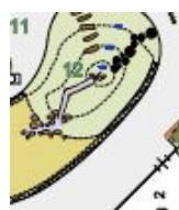
Heuvel met waterpomp

Het ontwerp is toegevoegd als bijlage 1.