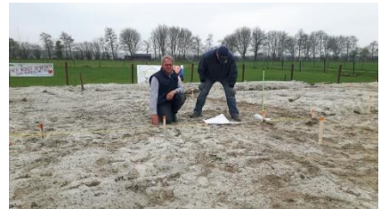
Inmeten en uitzetten v/d tuin