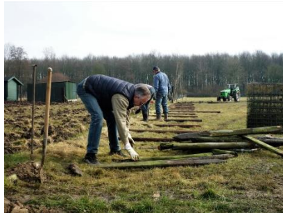
Zetten van hekwerk