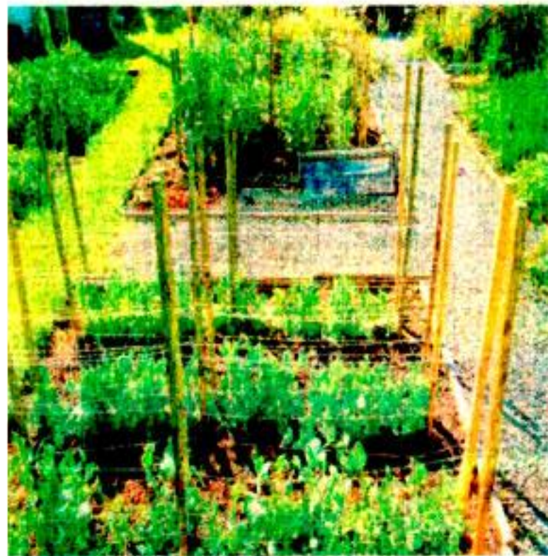
le basisscholen in Nederland moeten een moestuin krijgen.